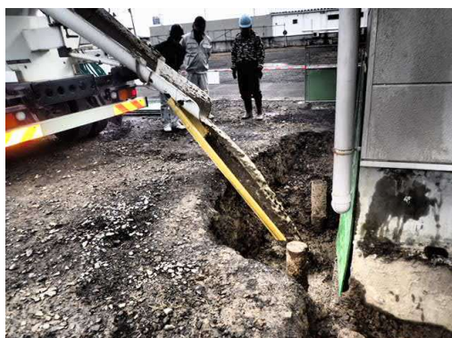
⑨ 流動化処理土 注入状況