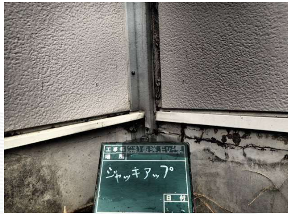
事後 エントランス側