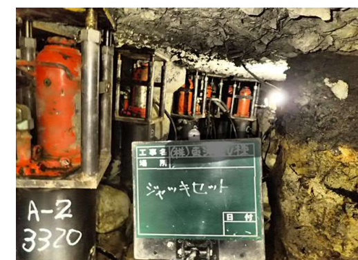
⑦ ジャッキアップ工事 油圧ジャッキ