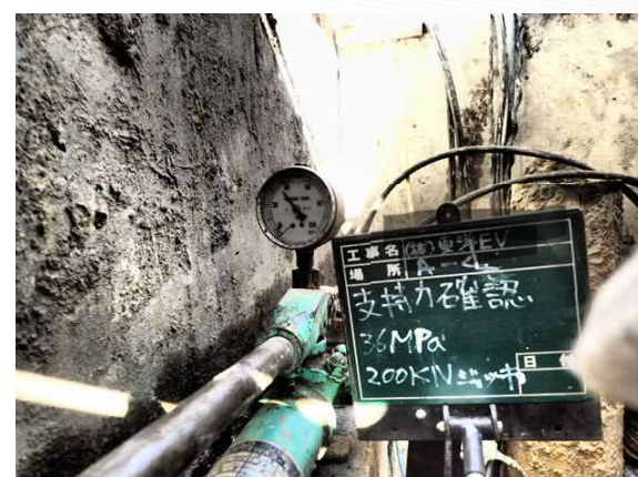
⑤ 鋼管圧入工事 ジャッキ台取り付け