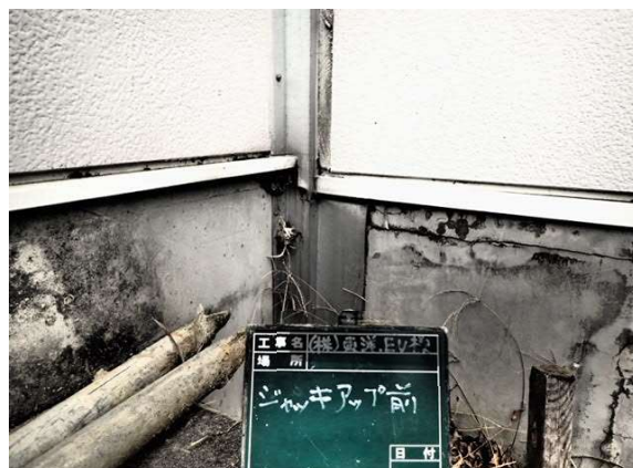
事前 エントランス側